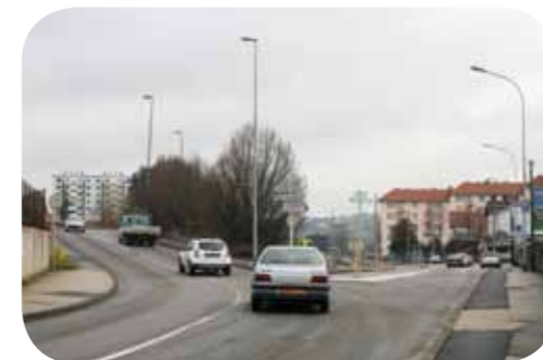
Le pont de Coligny avant sa démolition