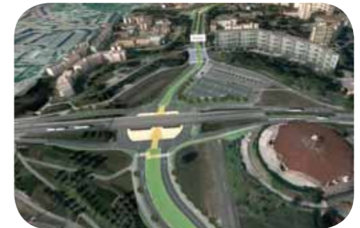
Le passage sous le pont de la RN 57

Réalisés par l'entreprise EIFFAGE TP pour permettre le passage du tramway entre Planoise et la Malcombe, les travaux sur le pont de Micropolis vont démarrer en avril pour une durée de 5 mois. Il s'agit de la construction d'un ouvrage en béton sous la route nationale 57 d'une longueur de 20 m et de 10 m de large. Les travaux seront réalisés par demi chaussée de la RN 57 de manière à maintenir la circulation sur la nationale sur une voie dans chaque sens.