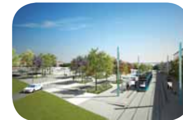
Pôle d'échanges Orchamps

Sur l'ensemble du tracé du tram, la plateforme sera habillée de verdure : dans le secteur de Palente et des Orchamps, 120 arbres seront plantés, 110 pour ce qui concerne le Fort Benoît et 134 pour les Marnières. Quatre variétés y seront représentées : des Prunus, des Amélanchiers, des Tulipiers et des Platanes. En complément, la plateforme sera engazonnée sur une longueur de 230 mètres sur le boulevard Léon Blum, sur 125 mètres à l'est de la rue des Cras et sur près de 800 mètres au niveau des Marnières.